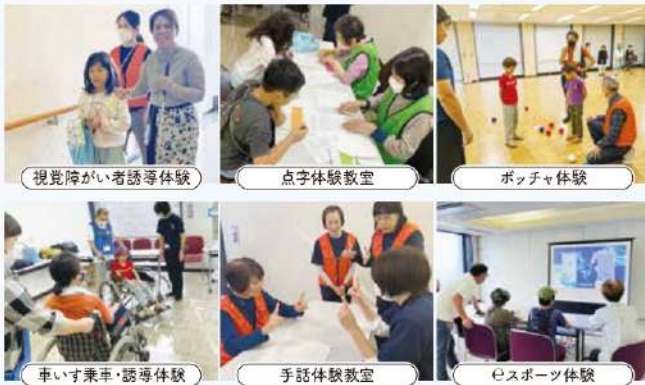
視覚障がい者誘導体験

株式会社柴橋商会・楽天家フレンドサービス・SOMPOケアラヴィーレ座間谷戸山公園・株式会社メディケアー大和営業所・エス・エスホームケア株式会社 株式会社イノベーション オブ メディカル サービス